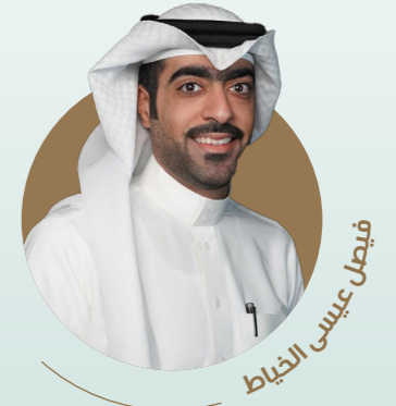
فيصل عيسى الخياط

برنامج يسعى إلى تعريف الشباب بأفضل الممارسات في العمل المؤسسي من خلال إتاحة الفرصة للقاء مع شخصيات قيادية مؤثرة للنقاش معهم، بما يؤهلهم للخروج بمبادرات ومشاريع مبتكرة تصب في تحقيق الأهداف الوطنية والارتقاء بالعمل الوطني.