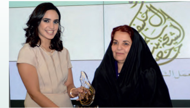
المركز الأول "أمنية لرعاية الطفل" أسسته الشيخة هالة بنت علي آل خليفة